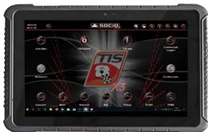
Art.-nr. 8-62100017 - Win10 10" Tablet