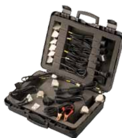
Kabelkoffer asiatische Fahrzeuge Art.-nr. 6011000305