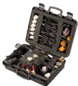
Kabelkoffer europäische Fahrzeuge Art.-nr. 6011000300