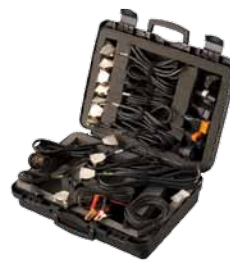
Kabelkoffer Lkw Basis Art.-nr. 6011000320