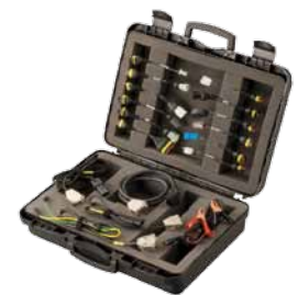
Kabelkoffer Motorrad Art.-nr. 6011000312