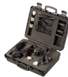
Kabelkoffer Anhänger Art.-nr. 6011000321