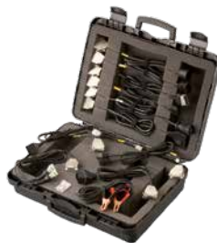
Maleta Cables Vehículos Asiáticos cod. 6011000305