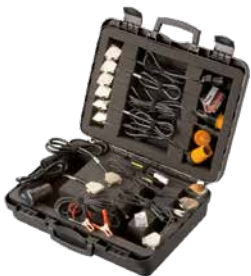
Maleta Cables Vehículos Europeos cod. 6011000300