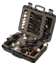
Maleta cables vehículos asiáticos cód. 6011000305