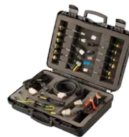
Maleta cables moto cód. 6011000312