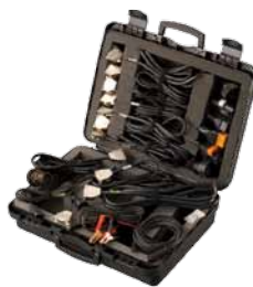
Maleta cables camión básico cód. 6011000320