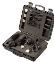
Maleta cables remolques cód. 6011000321