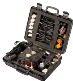
Maleta cables vehículos europeos cód. 6011000300